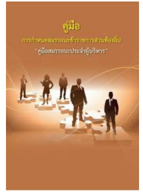
หนังสือ สมรรถนะประจำผู้บริหาร