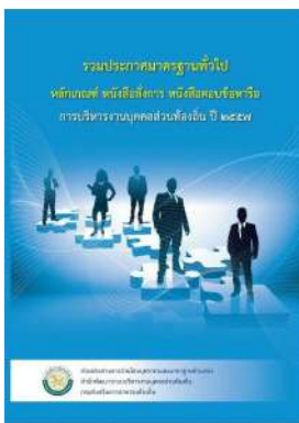
หนังสือ หลักเกณฑ์ หนังสือสั่งการ หนังสือตอบข้อหารือ การบริหารงานบุคคลส่วนท้องถิ่น ปี ๒๕๕๗