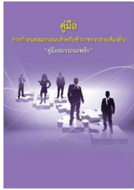
หนังสือ สมรรถะหลัก