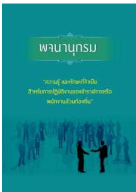
หนังสือ ความรู้ และทักษะที่จำเป็น สำหรับการปฏิบัติ งานของข้าราชการหรือพนักงานส่วนท้องถิ่น