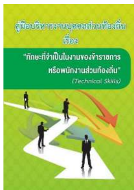
หนังสือ ทักษะที่จำเป็นในงานของข้าราชการ หรือพนักงานส่วนท้องถิ่น (Technical Skills)