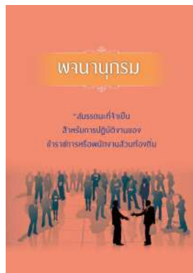
หนังสือ สมรรถนะที่จำเป็นสำหรับการปฏิบัติงานของ ข้าราชการหรือพนักงานส่วนท้องถิ่น