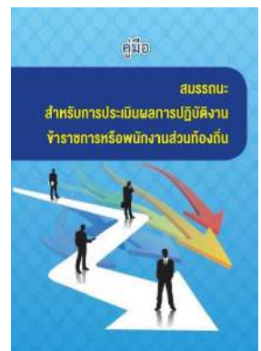
หนังสือ สมรรถนะสำหรับการประเมินผลการปฏิบัติงาน ข้าราชการหรือพนักงานส่วนท้องถิ่น