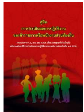
หนังสือ การประเมินผลการปฏิบัติงาน ของข้าราชการหรือพนักงานส่วนท้องถิ่น