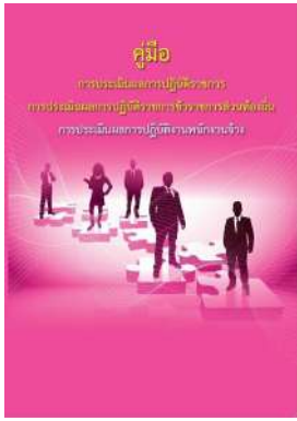
หนังสือ การประเมินผลการปฏิบัติงานพนักงานจ้าง