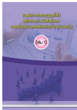
หนังสือ รวมประกาศมาตรฐานทั่วไป หลักเกณฑ์ หนังสือสั่งการ การบริหารงานบุคคลส่วนท้องถิ่น